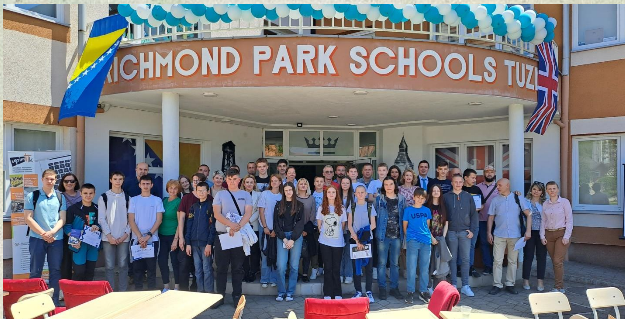
Učenci i njihovi mentori finalnog takmičenja iz opće informatike za učenike osnovnih škola TK