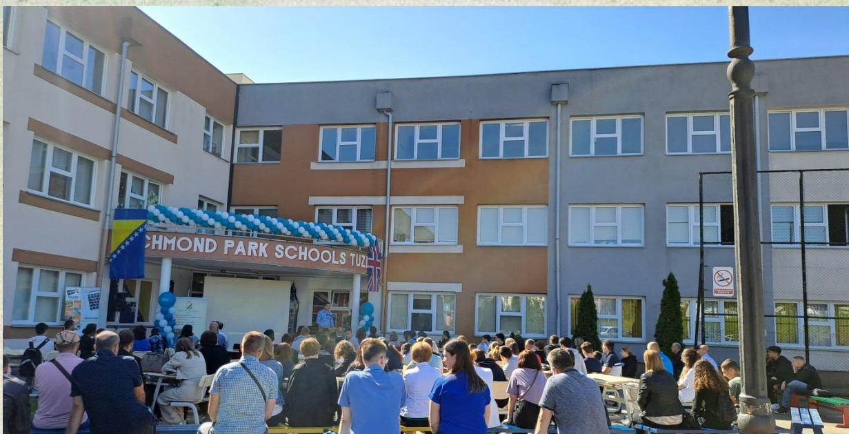
Ceremonija otvaranja ICT competition 024