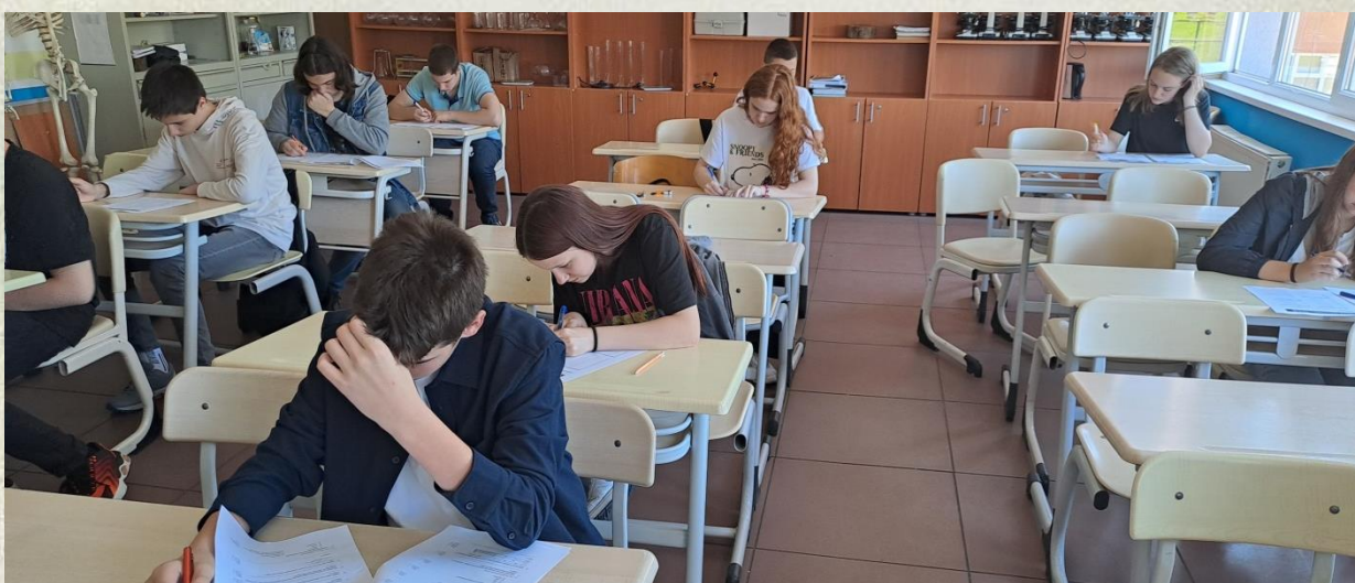
Detalji sa finalnog takmičenja putem testa – grupa B