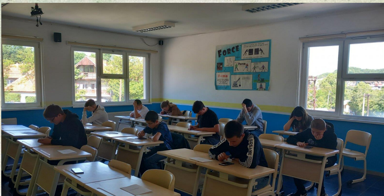
Detalji sa elektronskog takmičenja putem Quizizz – grupa Cc