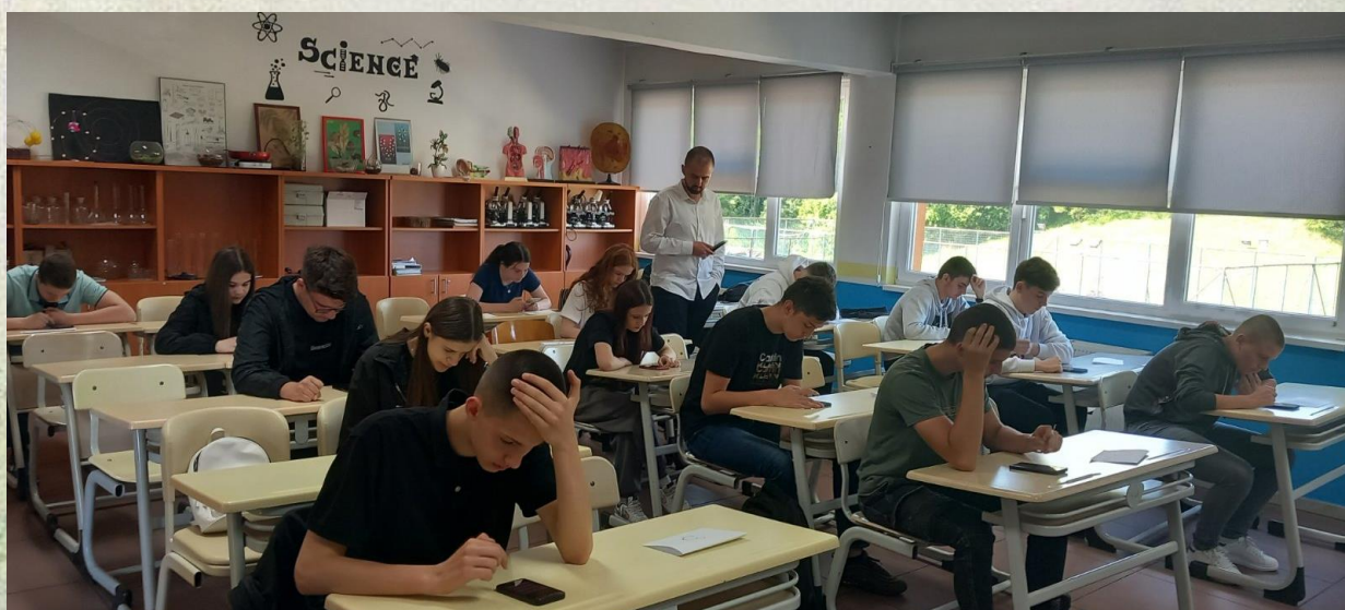
Detalji sa elektronskog takmičenja putem Quizizz – grupa B