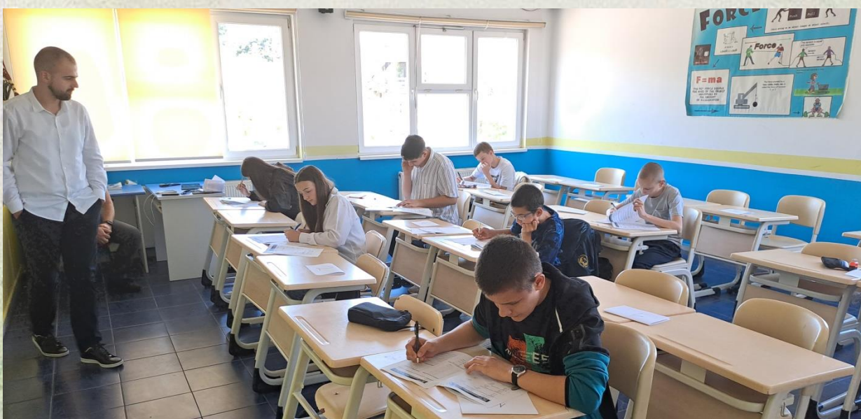
Detalji sa finalnog takmičenja putem testa – grupa C